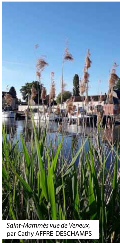
Saint-Mammès vue de Veneux, par Cathy AFFRE-DESCHAMPS

Pour envoyer vos photos, il suffit de les transmettre par email à communication@saint-mammes.com