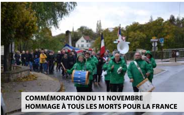
COMMÉMORATION DU 11 NOVEMBRE HOMMAGE À TOUS LES MORTS POUR LA FRANCE