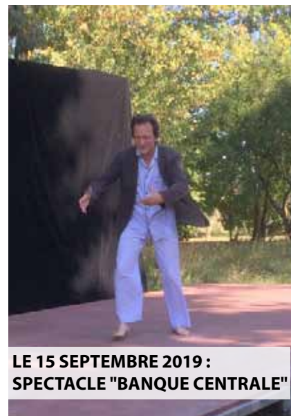
LE 15 SEPTEMBRE 2019 : SPECTACLE "BANQUE CENTRALE"