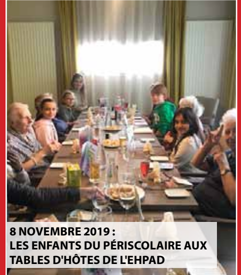
8 NOVEMBRE 2019 : LES ENFANTS DU PÉRISCOLAIRE AUX TABLES D'HÔTES DE L'EHPAD