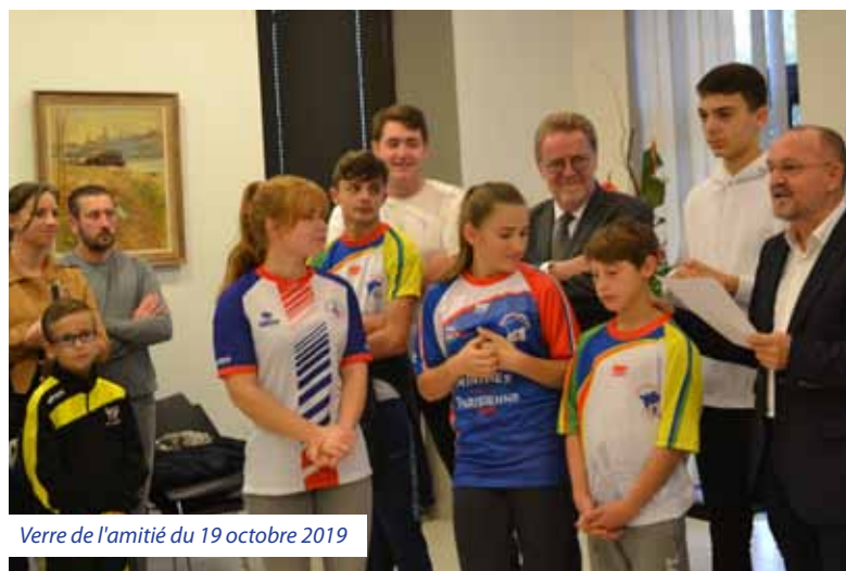
Verre de l'amitié du 19 octobre 2019