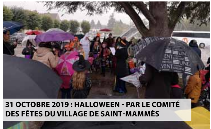
31 OCTOBRE 2019 : HALLOWEEN - PAR LE COMITÉ DES FÊTES DU VILLAGE DE SAINT-MAMMÈS