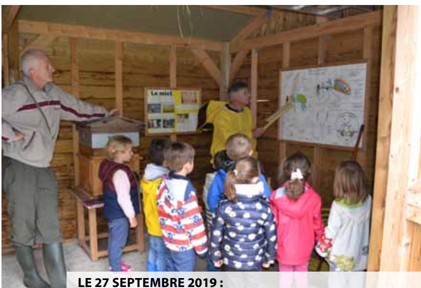
LE 27 SEPTEMBRE 2019 : VISITE DU RUCHER PAR UNE ÉCOLE DE FONTAINEBLEAU