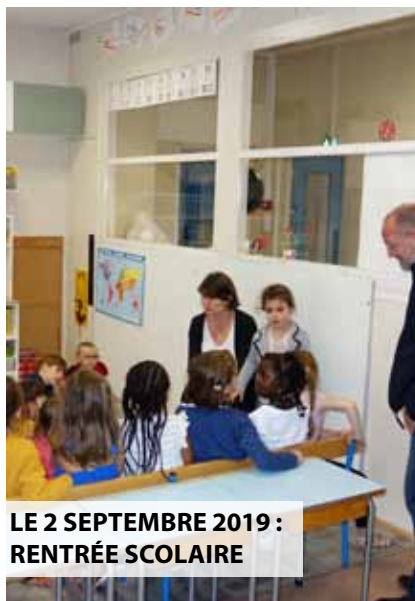
LE 2 SEPTEMBRE 2019 : RENTRÉE SCOLAIRE

Retrouvez les derniers S.M.I. sur le site www.saint-mammès.com