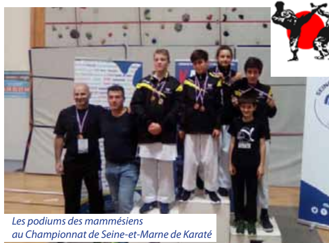
Les podiums des mammésiens au Championnat de Seine-et-Marne de Karaté