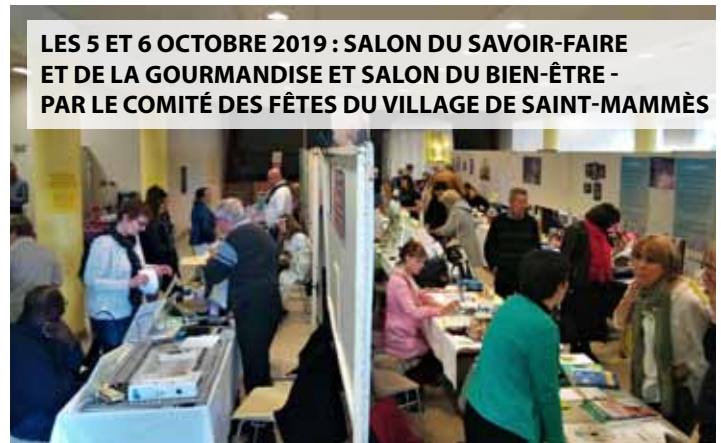
LES 5 ET 6 OCTOBRE 2019 : SALON DU SAVOIR-FAIRE ET DE LA GOURMANDISE ET SALON DU BIEN-ÊTRE - PAR LE COMITÉ DES FÊTES DU VILLAGE DE SAINT-MAMMÈS