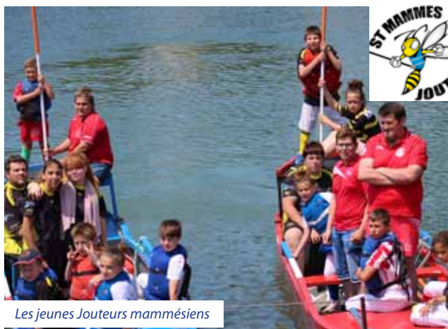
Les jeunes Jouteurs mammésiens