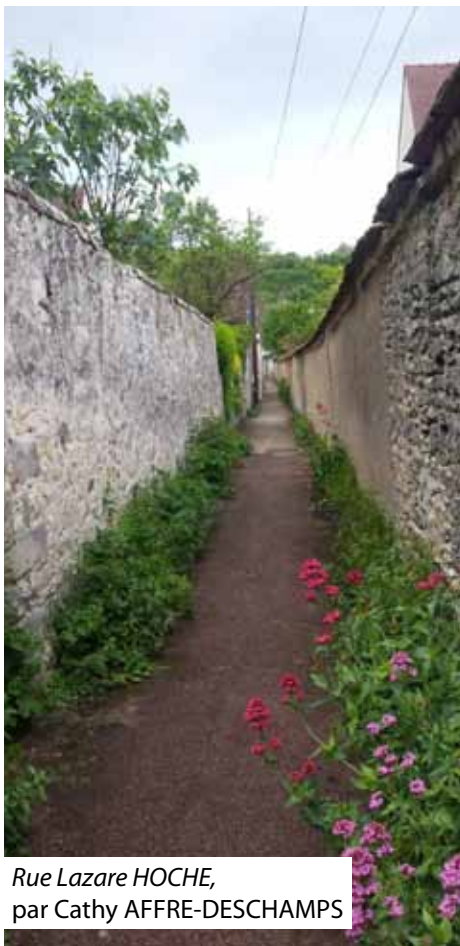
Rue Lazare HOCHÉ, par Cathy AFFRE-DESCHAMPS