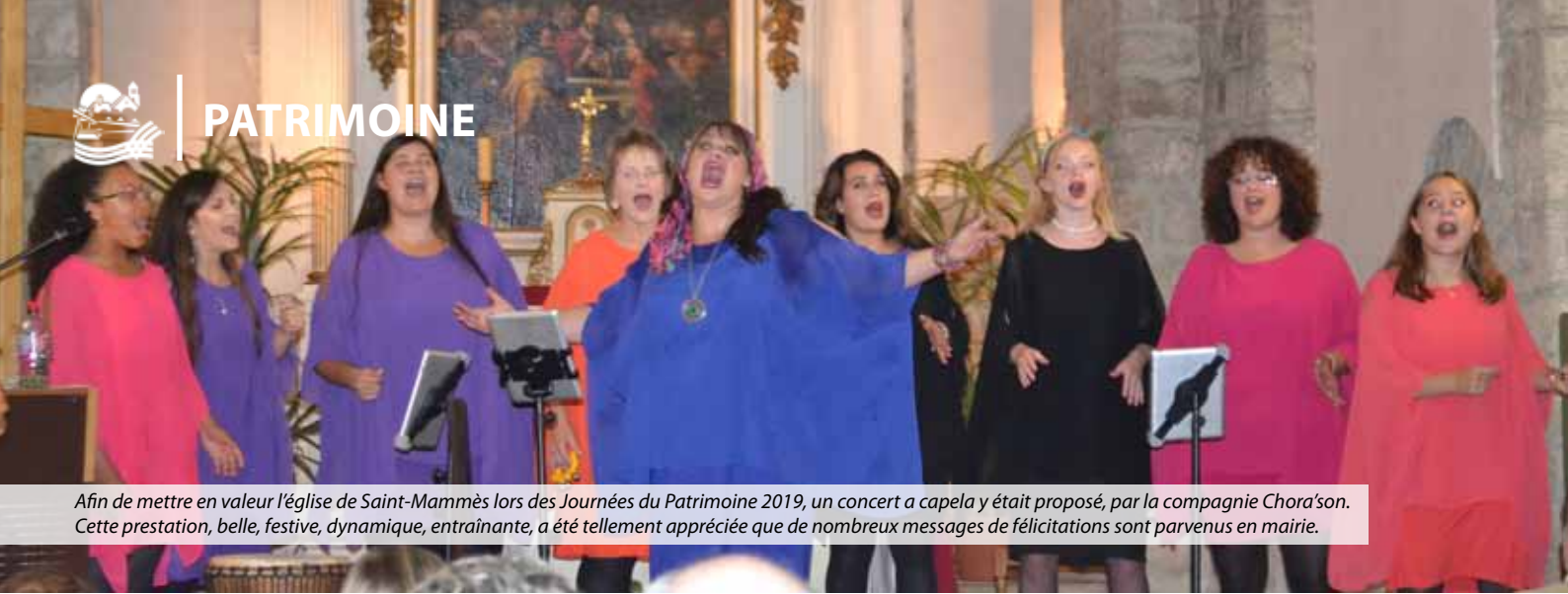
Afin de mettre en valeur l'église de Saint-Mammès lors des Journées du Patrimoine 2019, un concert a capella y était proposé, par la compagnie Chora'son. Cette prestation, belle, festive, dynamique, entraînante, a été tellement appréciée que de nombreux messages de félicitations sont parvenus en mairie.