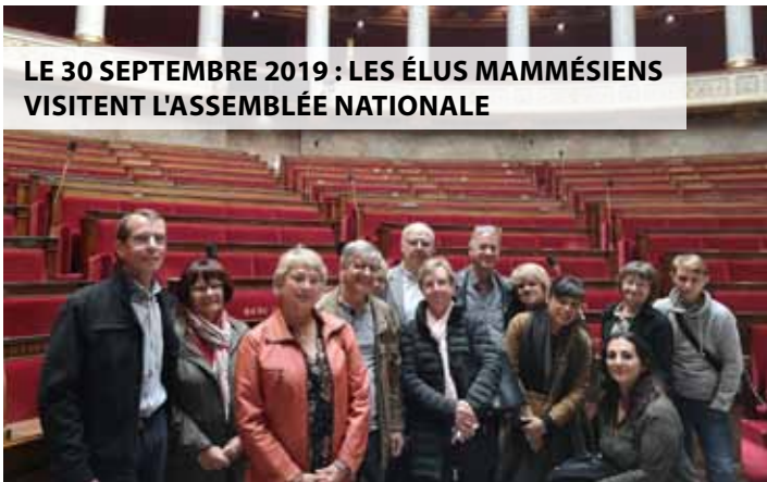
LE 30 SEPTEMBRE 2019 : LES ÉLUS MAMMÉSIENS VISITENT L'ASSEMBLÉE NATIONALE