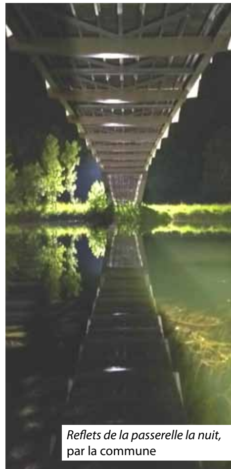
Reflets de la passerelle la nuit, par la commune