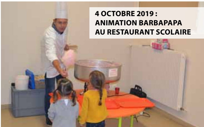
4 OCTOBRE 2019 : ANIMATION BARBAPAPA AU RESTAURANT SCOLAIRE