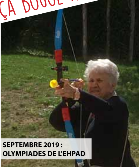
SEPTEMBRE 2019 : OLYMPIADES DE L'EHPAD