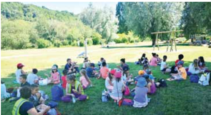
PIQUE-NIQUE DU PÉRISCOLAIRE - 2 JUILLET 2019