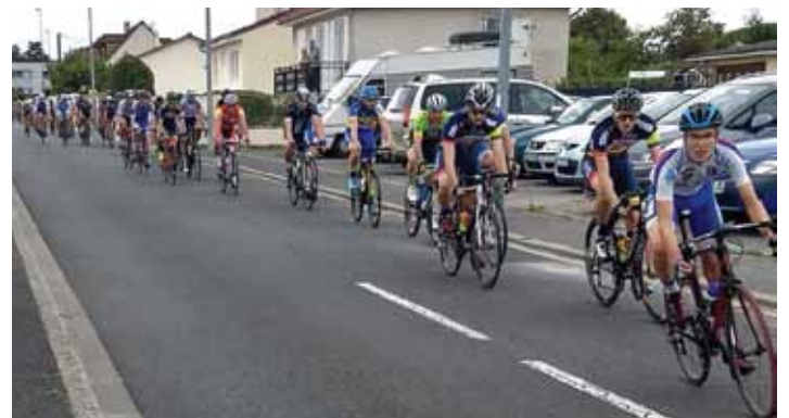
COURSE CYCLISTE - 15 AOÛT 2019