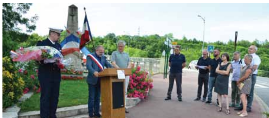
COMMÉMORATION DE L'APPEL DU GÉNÉRAL DE GAULLE - 18 JUIN 2019

Retrouvez les derniers S.M.I. sur le site www.saint-mammes.com