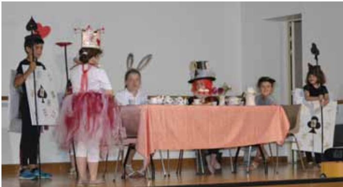
SPECTACLE DE FIN D'ANNÉE DES ENFANTS DU PÉRISCOLAIRE - 25 JUILLET 2019