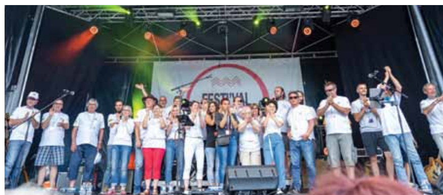
FESTIVAL EN SEINE - 15 & 16 JUIN 2019