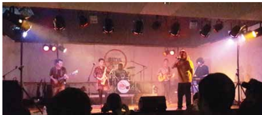
FEST'OFF - 18 MAI